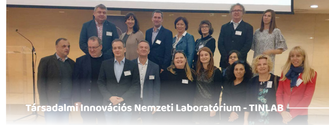
Társadalmi Innovációs Nemzeti Laboratórium - TINLAB

2020 őszén alakult meg a Társadalmi Innovációs Nemzeti Laboratórium (TINLAB) , amelynek fő célja olyan innovációk megvalósítása, amelyek hozzájárulnak a társadalom jólétéhez, elősegítik új társadalmi együttműködések kialakulását.